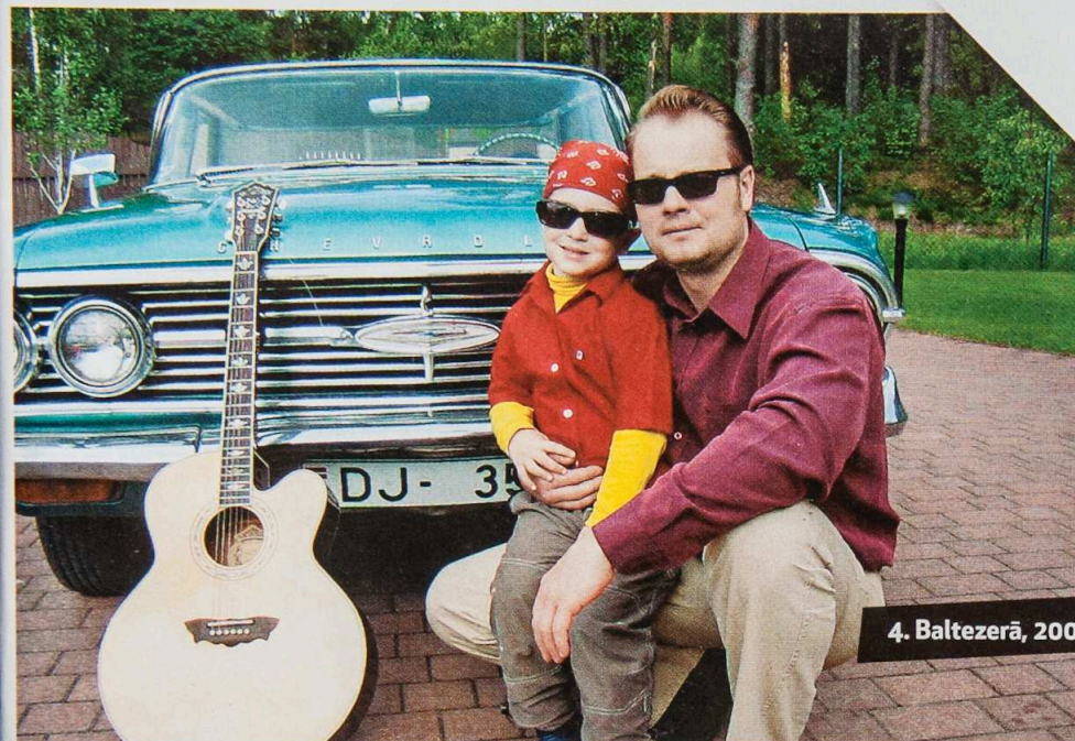
4. Baltezerā, 2006