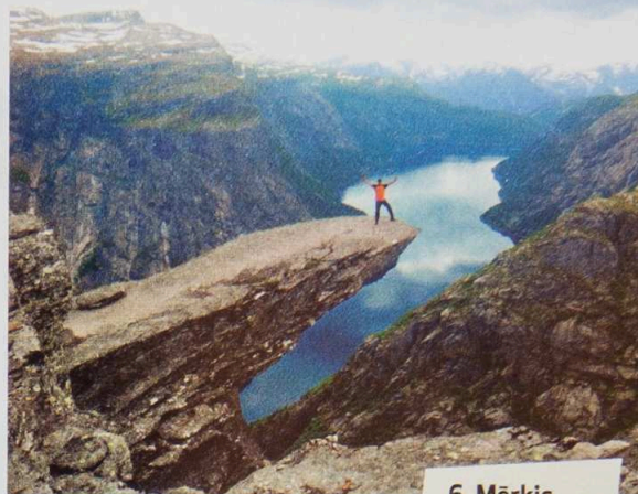
6. Mērķis sasniegts. Trollu mēles galiņā, 2013